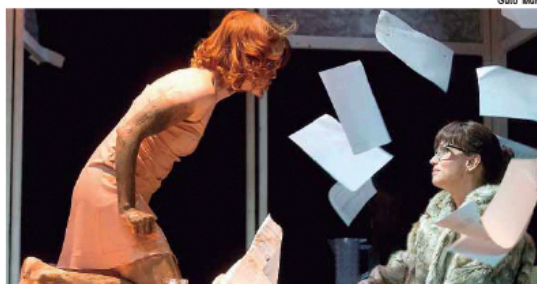
As sessões serão no Teatro do Engenho, às 18h30 e 21 horas

Ainda no primeiro dia de mostra oficial, o Centro Cultural Martha Watts recebe os piracicabanos